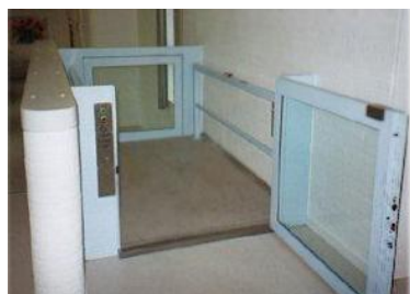
Handicapelevator med halv dør ved øverste stop.