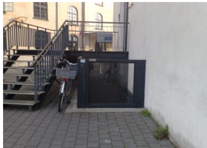
Varelift fra gadeniveau til kælder.