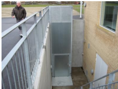
Lift i beboelsesejendom.

Godkendt af Arbejdstilsynet. Kvalitetsledeshåndbog DS/EN ISO 9001 Certifikatnr. 2011.0147.0007/0