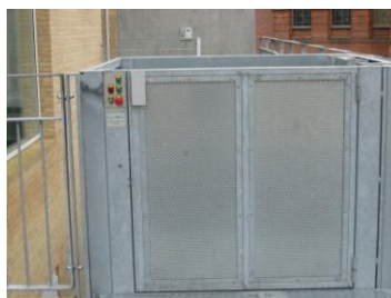
Handicap elevator med halv dør ved øvre stop.