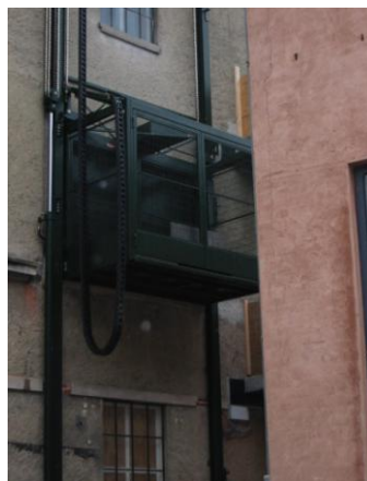
Udvendig varelift på lagerbygning.