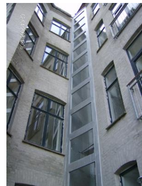
Personelevator i nyrenoveret beboelsesejendom i København.