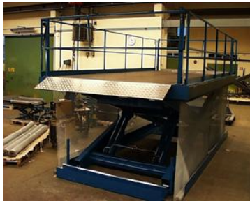
Løfteplatform på Reparationsværksted.

Til handicaptransport, til persontransport, til godstransport, som arbejdsplatforme og meget mere.