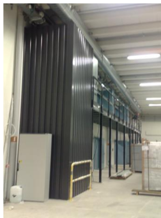
Rigsarkivet i København.