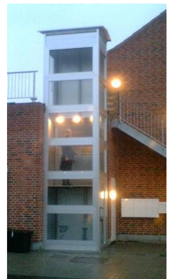
Lift i beboelsesejendom.