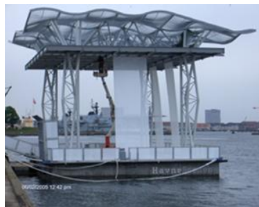
Indbygget lift i Havnescenen, København.