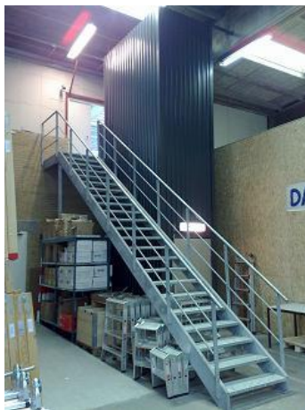
Elevator i lagerhal.