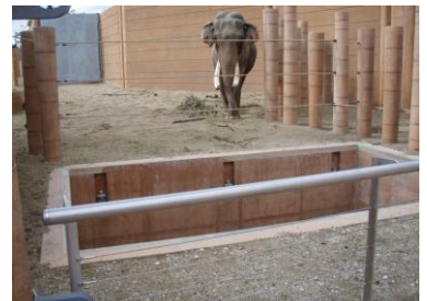
Løfteplatforme for adskillelse af de enkelte områder i elefantsavannen i ZOO.

Scenelifte til teatre og kulturhuse mm. Kan bruges som almindeligt gulvniveau. Hvis liften køres ned kan den bruges som orkestergrav. Skuespillere/sangere kan entrere "op gennem gulv". Transport af rekvisitter fra kælder til gulvniveau. Kan også bruges som podie til forlængelse af scene mm.