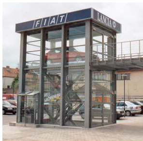
Lift til biludstilling.