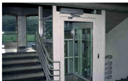
Elevator i beboelsesejendom.