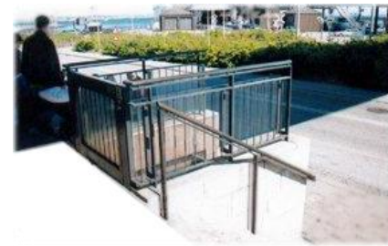
Handicapelevator på Helsingør Station.