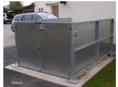
Elevator til person- og varekørsel.