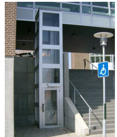
Udvendig elevator i bycenter.