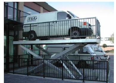
Intern transport af biler