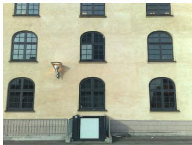
Godselevator fra gadeniveau til kælder. Harvings Pakhus.