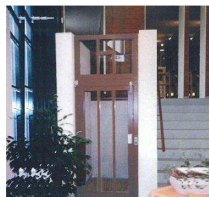
Elevator på hotel som er renoveret og tilbageført til oprindelig stil.