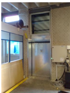
Elevator med 3 stop i produktionshal.