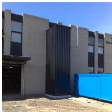
Udvendig elevator på trykkeri.