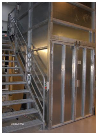
Elevator på hjælpemiddelcentral.