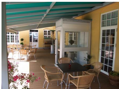
Elevator fra gadeniveau til øvre terrasse på restaurant.

Godkendt af Arbejdstilsynet. Kvalitetsledeshåndbog DS/EN ISO 9001 Certifikatnr. 2011.0147.0007/0