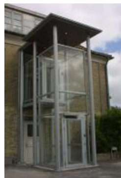
Udvendig elevator på plejehjem.